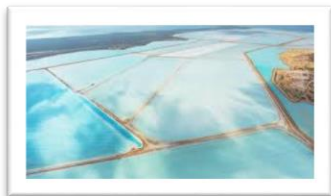
オーストラリア シャークベイの塩田風景

お塩は必要ないと誤解をまねくような情 報があるようですが、お塩は人間と同様に 犬にとっても必須の栄養素(ミネラル成 分)です。塩分が不足すると水分調整がで きなくなり、成長抑制、食欲不振、脱毛な どが起こるといわれています。ドッグフー ド工房には微量ではありますが必要な量を 調整して入れております。